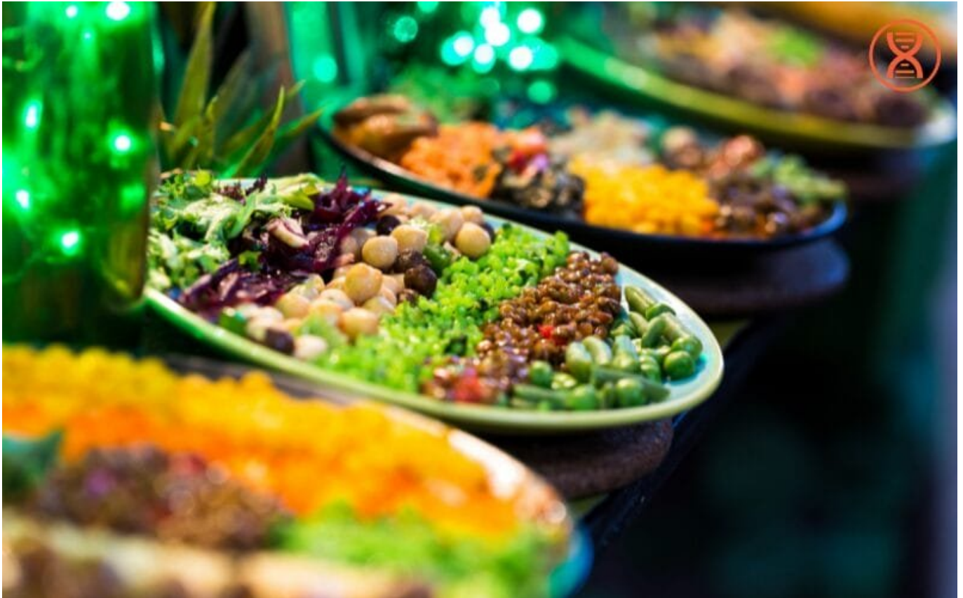
Bổ sung nhiều dưỡng chất có trong các loại thực phẩm

chức năng hoặc thực phẩm được bổ sung vitamin.