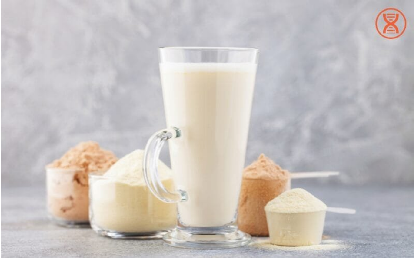
Uống các loại sữa và bột từ các loại hạt rất tốt cho cơ thể