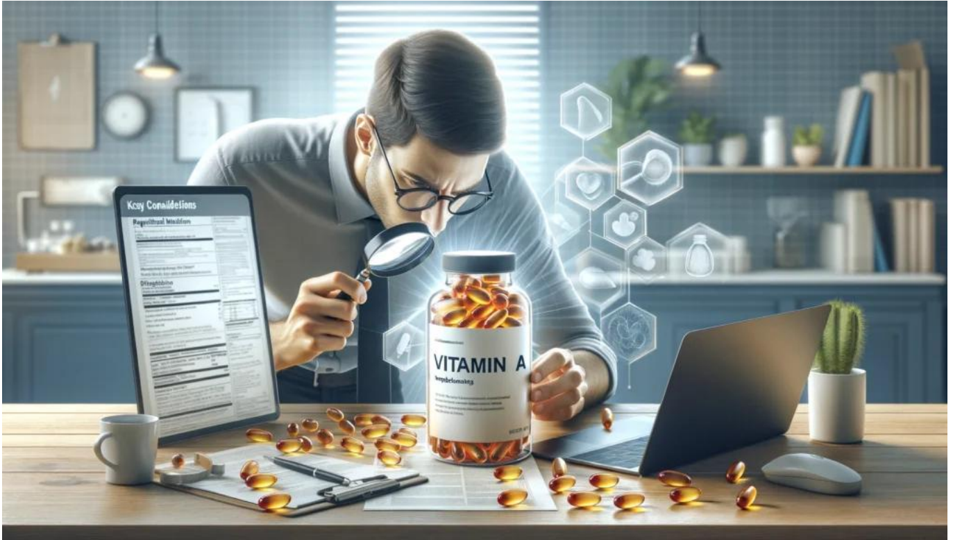
Những lưu ý khi sử dụng thực phẩm bổ sung vitamin A