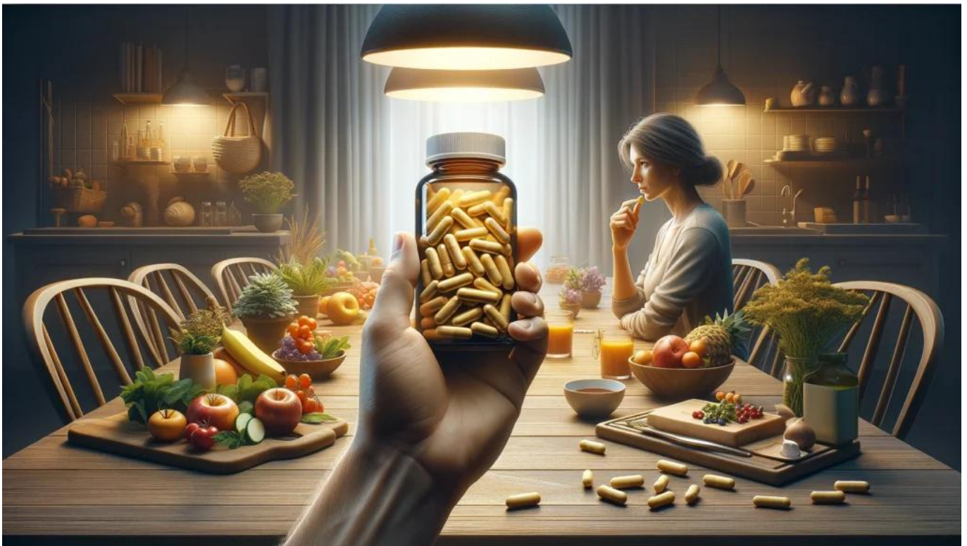
Thực phẩm bổ sung vitamin A