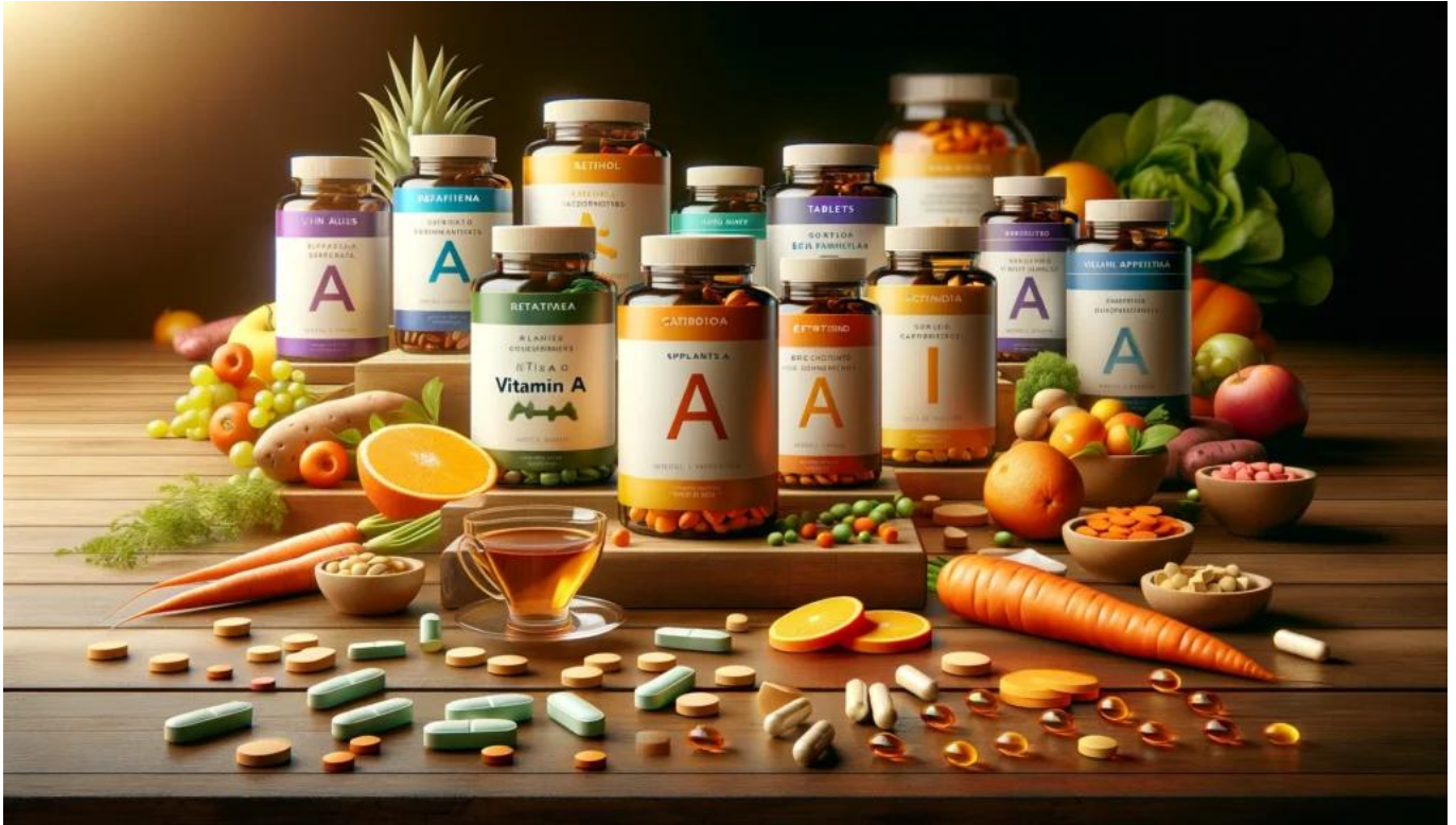
Các dạng vitamin A trong thực phẩm bổ sung