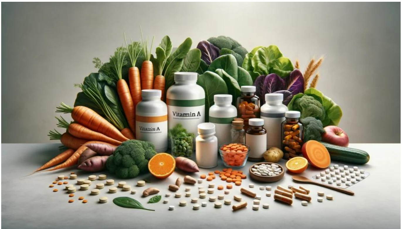
Thực phẩm bổ sung vitamin A