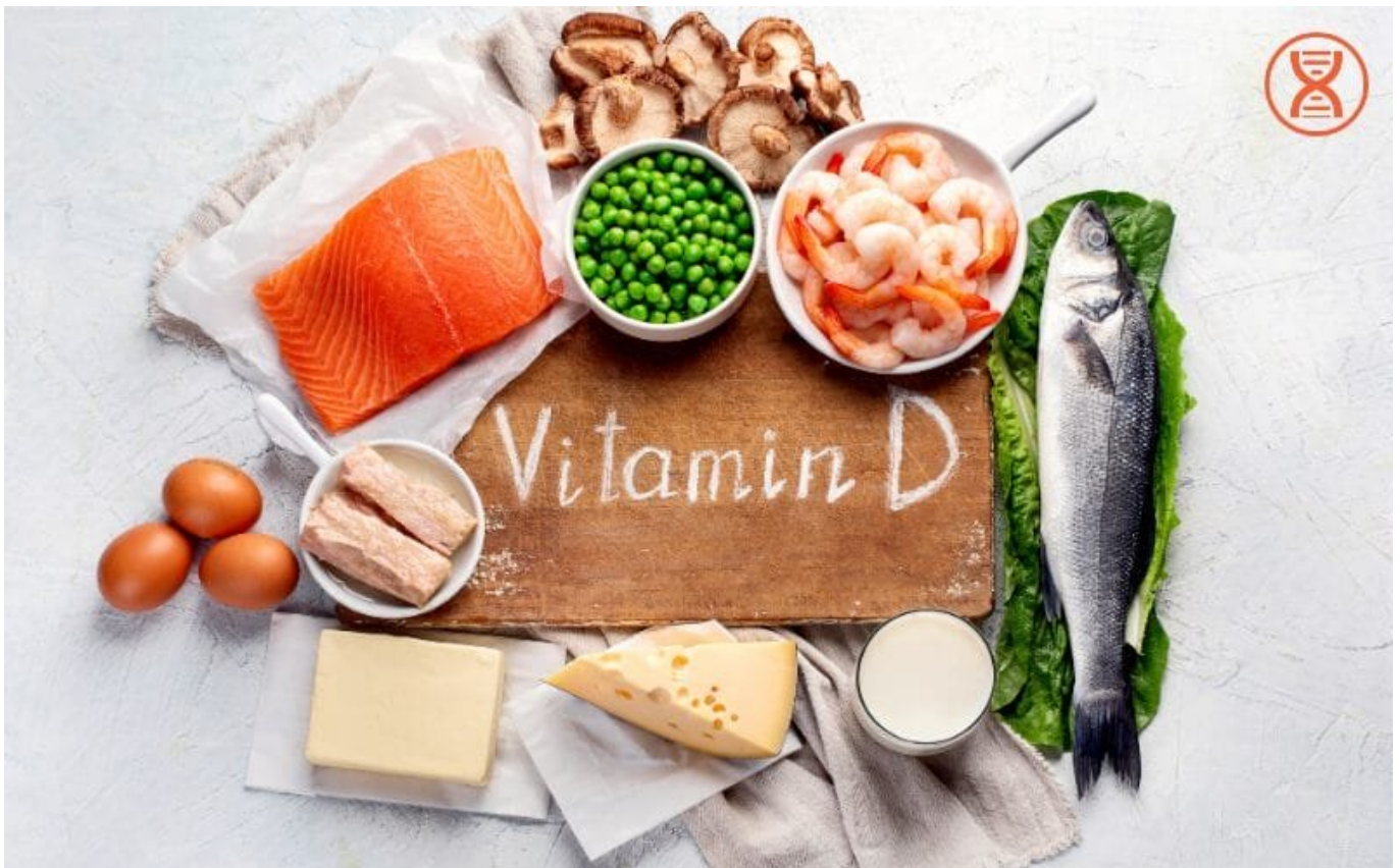
Vitamin D hỗ trợ quá trình hấp thụ canxi từ thức ăn

Vitamin D hỗ trợ quá trình hấp thụ canxi từ thức ăn. Năng lượng mặt trời là nguồn tự nhiên tốt nhất của vitamin D, nhưng cũng có thể được bổ sung thông qua thực phẩm như cá hồi, trứng và thực phẩm giàu vitamin D.