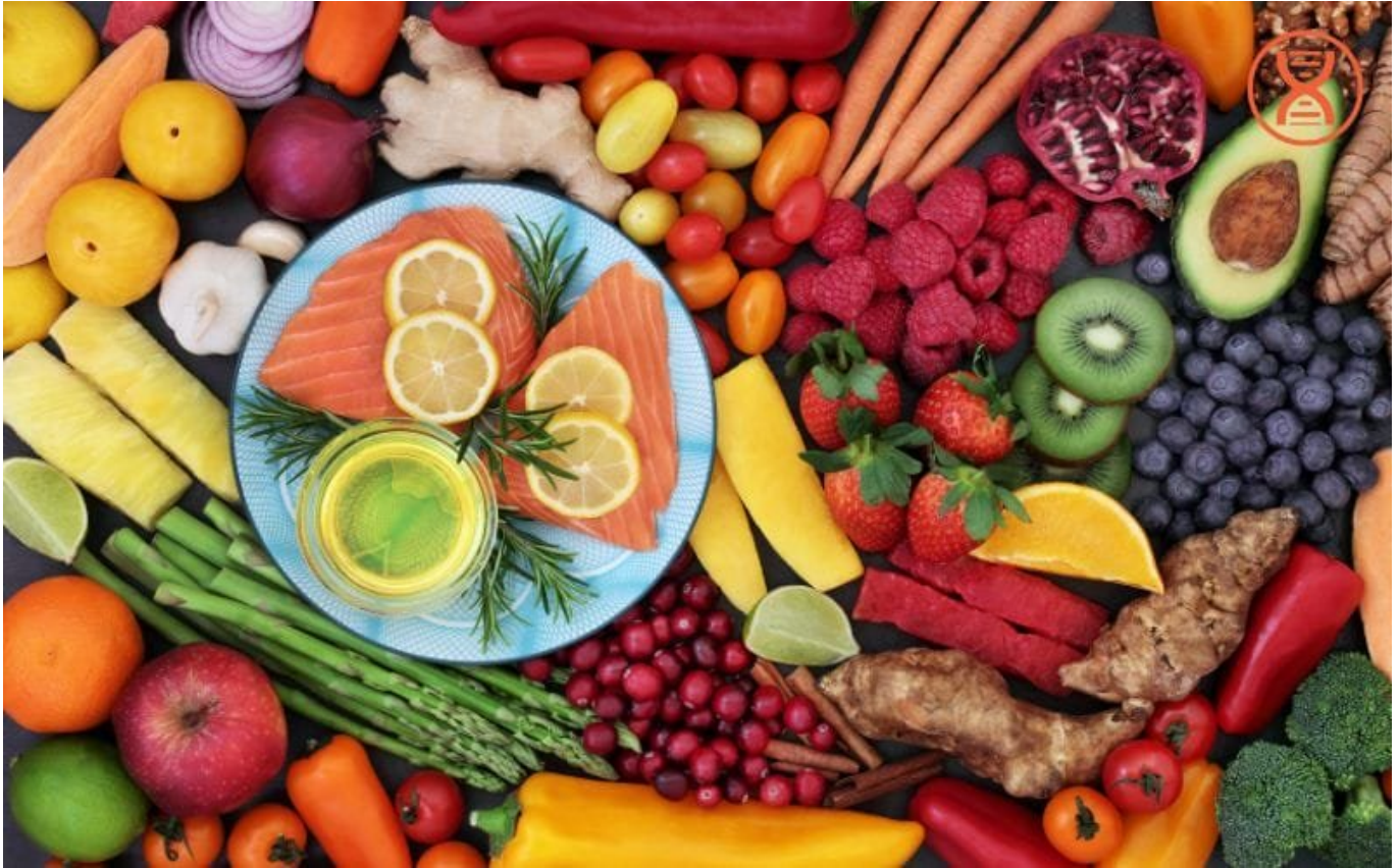
Có kỹ năng đánh giá các loại thực phẩm tốt cho sức khỏe