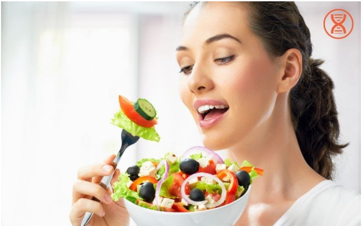
Điều chỉnh thói quen ăn uống để bổ sung dinh dưỡng cho cơ thể

Áp dụng những thay đổi nhỏ từ kế hoạch dinh dưỡng của bạn vào thực tế. Bắt đầu từ việc thay thế các thực phẩm không lành mạnh bằng các lựa chọn tốt hơn, giảm bớt đường, muối và chất béo không lành mạnh. Điều chỉnh từng bước nhỏ sẽ giúp dần dần thích nghi và duy trì được lối sống dinh dưỡng lành mạnh hơn.